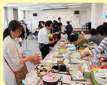
「相看祭」のバザーの様子